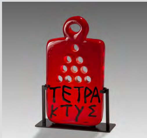
Joe Tilson Tetraktys 1 , verre soufflé troué, portant l'inscription grec « ΤΕΤΡΑΚΤΥΣ » plaquée à chaud (noir sur rouge), sur support en métal. 36,5x19,5x3,5cm, 2007. Collection Denise et Marcel Heider.