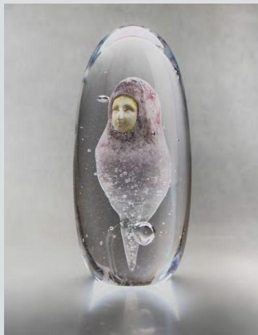
Sandrine Isambert, Aurae , verre coulé, inclusion pâte de verre émaillée, 2016.