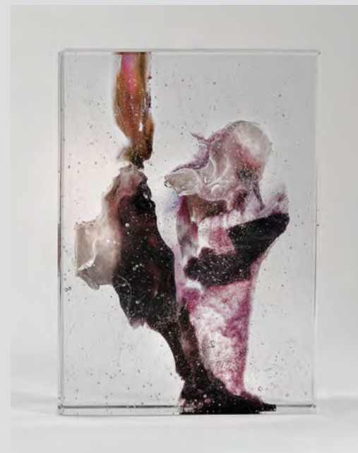
Antoine Leperlier Espace d'un Instant XXVIII , pâte de verre à inclusion triple cuisson, cadre acier noir, 33x33x24cm (verre), 80x59x20cm (cadre), n°2180117, 2018.