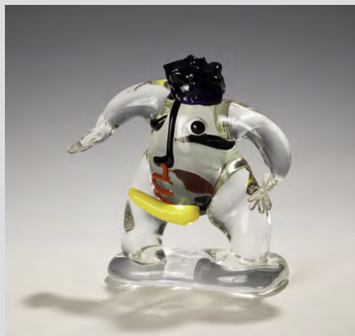
Juan Garcia Ripollés Hombre (Piccolo) , verre soufflé, 28x28x11cm, 2014. Collection Denise et Marcel Heider.

Une occasion pour les connaisseurs de goûter encore aux plaisirs de cet art et de se remémorer sa vitalité ; une occasion unique pour les non-initiés de découvrir des univers, des imaginaires, des approches conceptuelles et des savoir-faire. Une occasion pour tous de vivre une expérience exaltante.