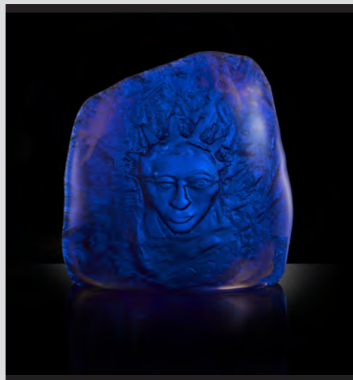
Yan Zoritchak, Star , verre fusionné, taillé, poli, 45x57x17cm, 2020. Courtoisie de l'artiste. Photographie © Pedro Granero.