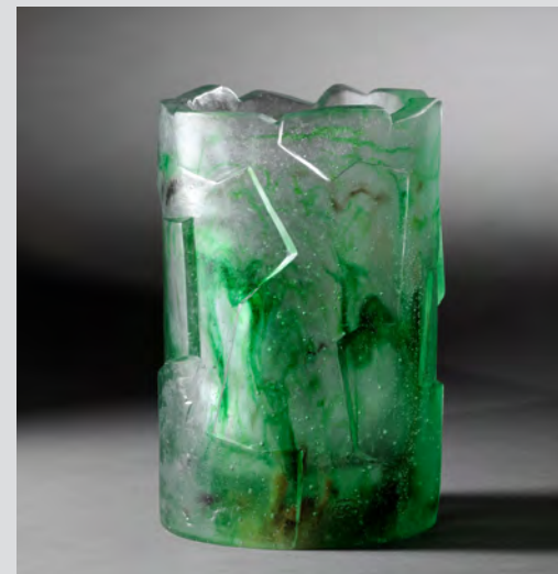
Erich Schamschula Vase-sculpture , pâte de verre translucide aux inclusions vertes, 24x15cm, 1982. Collection Hélène et Philippe Vaissière.