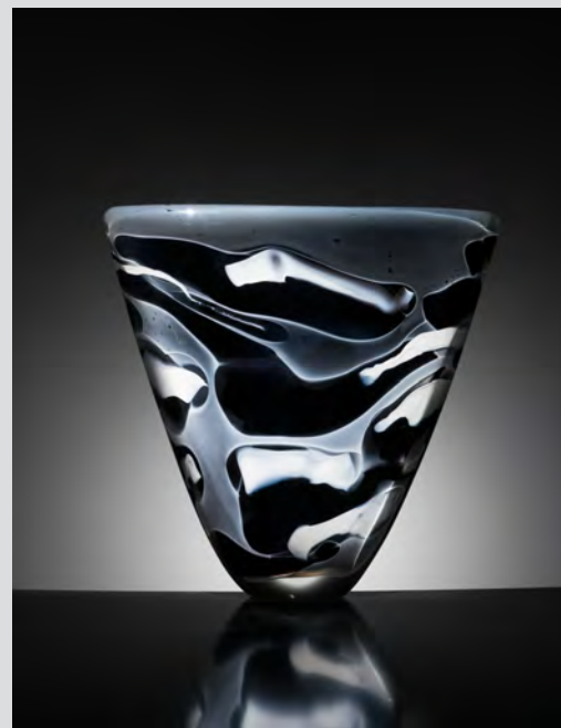
Marisa & Alain Bégou Pièce , verre soufflé, décors intercalaires, 28,7x29,2x8,5cm, 1988. Collection privée.