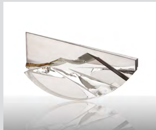
Matei Negreanu Sans titre , verre (optique) taillé, brisé, poli et bandes de plomb, 31,5x54,5x14cm, circa 95. Collection Denise et Marcel Heider.