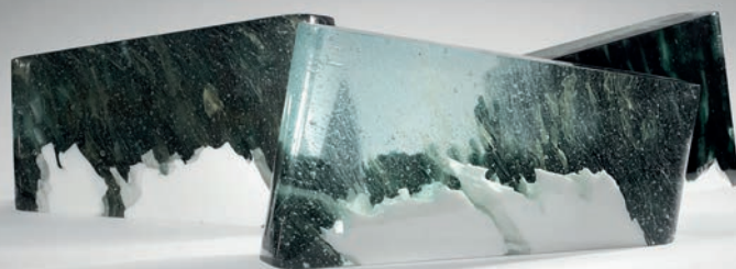
PERPETUAL – 2019 / Sculpture en verre « Build-in-Glass » 9 Pièces uniques - H 25 x L 46 x P 10cm / © Briolant