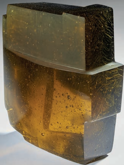
NOCTURAL – 2015 / Sculpture en verre « Build-in-Glass » Pièce unique - collection publique - H 22,5 x L 19,5 x P 9cm / © Briolant

A partir du 29 novembre, le public découvrira une sélection de près de trente œuvres de ces artistes hors du commun, avec la présentation de l'installation X-Press, acquise en 2017 par la Ville de Charleroi pour le Musée du Verre.